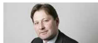
Pascal Gentinetta Directeur economie suisse

Pour 2010, economie suisse s'attend à un taux de croissance de 0,7 % et à un taux de chômage de 4,9 %. Les risques d'une baisse de la conjoncture restent importants. suite »