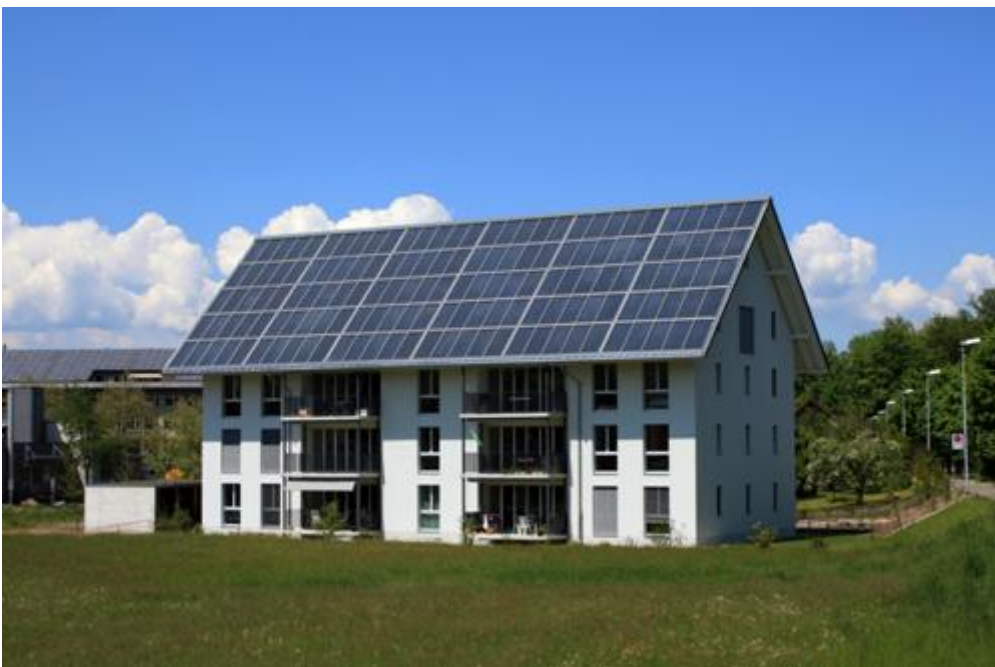
Immeuble chauffé à 100% grâce à l'énergie solaire.

A ses débuts, l'entreprise était active dans plusieurs domaines de l'énergie solaire, aujourd'hui elle se concentre sur la production de systèmes solaires thermiques. Leur pièce maîtresse est un accumulateur d'une capacité de 1200 à 120 000 litres d'eau selon les besoins employant une technologie spéciale avec chauffe-eau intégré. Ce produit fabriqué en série s'appelle Swiss Solartank. Associé à des capteurs solaires, il permet de chauffer une maison et de produire l'eau chaude nécessaire tout au long de l'année. Ce concept séduit à une époque où on craint une pénurie d'énergie et la dépendance énergétique : 13 000 Swiss Solartanks ont été installés et les commandes affluent toujours. Un tiers des commandes viennent d'Allemagne. Le Swiss Solartank convient également pour les maisons en préfabriqué.