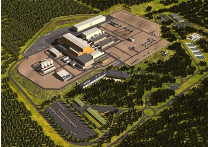
Modellaufnahme von ITER

Der Energiebedarf der Menschheit steigt und steigt. Angesichts sinkender Vorräte an fossilen Brennstoffen und zunehmender CO 2 -Belastung wird der Ruf nach einer unerschöpflichen, sauberen und wirtschaftlichen Energiequelle laut. Die Kernfusion verspricht sämtliche dieser Bedingungen zu erfüllen. Im südfranzösischen Cadarache wird zurzeit unter Schweizer Beteiligung der erste Fusionsreaktor gebaut, vorerst ausschliesslich zu Forschungszwecken. Sein Name: ITER.