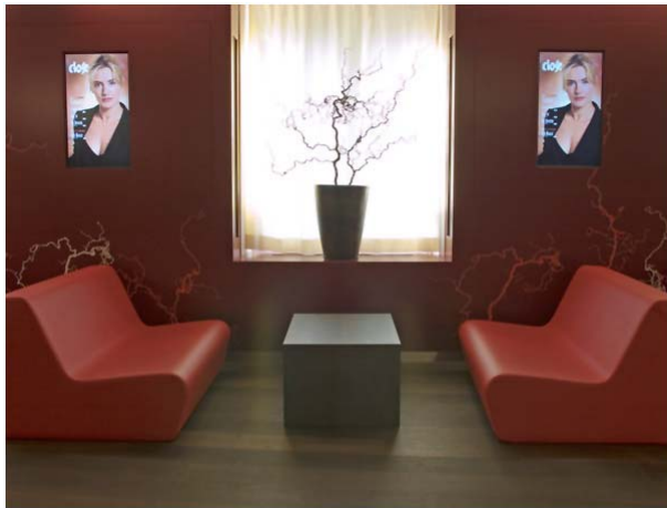
Das Kitag-«Frauenkino» in Zürich