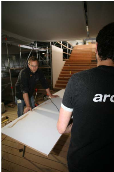
Aroma-Mitarbeiter produzieren das Interieur eines temporären Hospitality-Baus