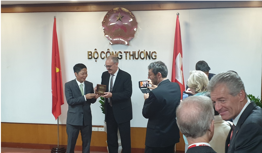
Bundesrat Parmelin mit dem Wirtschaftsminister Tr?n Tu?n Anh bei der Geschenksübergabe.